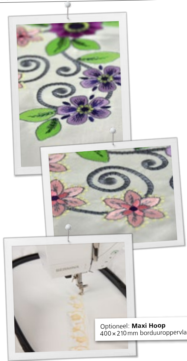
Optioneel: Maxi Hoop 400 x 210 mm borduroppervlak